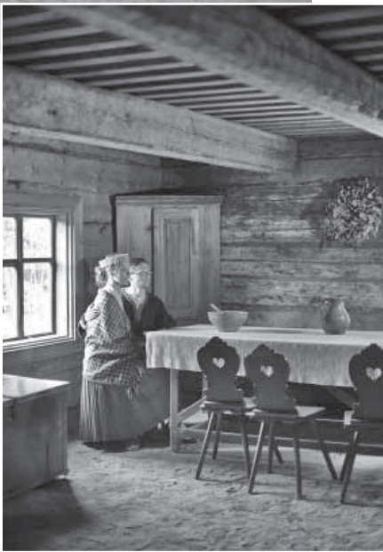
Biržu "Brūveru" māju saimes istaba; meitai sēļu tautastērps, attiecināms uz 16.gs.

Nupat kā ir nostiprinājusies doma, ka Salas novada LOGO simbols būs atslēga, kā atgādinājums par senajiem laikiem, kad seno sēļu pils Sēlpils pilskalnā bijis atzīts un stratēģiski svarīgs Sēlijas novada centrs – Sēlijas vārti. Katriem vārtiem rodama arī sava atslēga. Un aiz šiem vārtiem no aizvēsturiskiem laikiem ir ritējušas cilvēku dzīves. Kādi bija šie mūži – mūsu