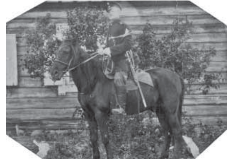
uradņiks (kārtībnieks) Sēlpilī;

Sadzīve un rocība mūsu senčiem bija paknapa. Dūmaina koka istaba. Tās garums vidēji 9 aršinas (apmēram 6,39 m) un platums 8 aršinas. Griesti klāti no šķeltiem baļķiem, grīdas vietā klons. Dažiem ir pat divi logi: katrs mazāks par ¼ aršinas. Iepretim ceplim ir dūmenieks (caurums, pa kuru iziet dūmi) ar koka aizšaujām durtiņām vai aizbāžams ar lupatām. Liels akmens ceplis, uzmūrēts uz koka „syrūba” (groda), bez skursteņa ar nelielu pavardu. Ceplis aizņem 1/8 daļu no istabas. Istaba ir bez reliģiskām nokrāsām: kaktā stāv tikai no dūmiem nokvēpis krusts. Pie istabas ir priekšnams (1/4 no istabas platības), kas atdala istabu no klēts vai kambara. Priekšnamam ir 4 durvis: uz istabu, kambari, pagalmu un laidaru. Istabai ir dzītais, citām ēkām – aplaisti (ar vārpām uz leju) cisu (salmu) jumti. Istaba ir drūma, nekārtīgi apkopta, šaura un smacīga. No mēbelēm ir tikai galds, vidēji divi soli un divas gultas. Pie „stulpa” (staba) ir pakārta kaste (plaukts) traukiem. Tajā saliktas 2-3 māla bļodas un vajadzīgais skaits koka karošu.