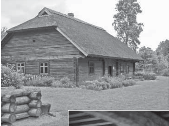
„Brūveru” saimes māja, celta 1850.gadā Biržos (atrodas „Sēļu sētā”)

Nupat kā ir nostiprinājusies doma, ka Salas novada LOGO simbols būs atslēga, kā atgādinājums par senajiem laikiem, kad seno sēļu pils Sēlpils pilskalnā bijis atzīts un stratēģiski svarīgs Sēlijas novada centrs – Sēlijas vārti. Katriem vārtiem rodama arī sava atslēga. Un aiz šiem vārtiem no aizvēsturiskiem laikiem ir ritējušas cilvēku dzīves. Kādi bija šie mūži – mūsu